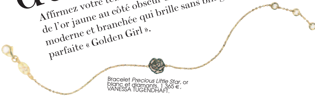
Bracelet Precious Little Star, or blanc et diamants, 1 365 €, VANESSA TUGENDHAFT.

Affirmez votre tendance chic et glamour en osant assortir le luxe de l'or jaune au côté obscur d'une pierre noire. Une fusion moderne et branchée qui brille sans bling-bling pour une parfaite « Golden Girl ».