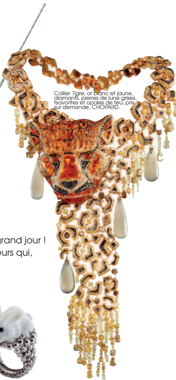
Collier Tigre , or blanc et jaune, diamants, pierres de lune grises, tsavorites et opales de feu, prix sur demande, CHOPARD.