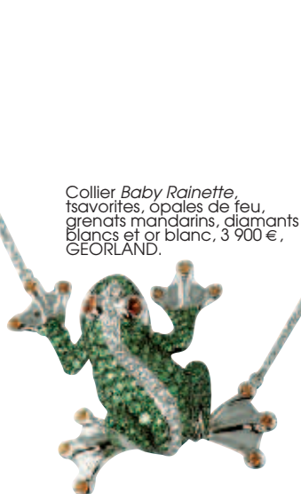
Collier Baby Rainette , tsavorites, opales de feu, grenats mandarins, diamants blancs et or blanc, 3 900 €, GEORLAND.