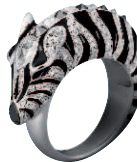
Bague Zèbre , diamants blancs, diamants noirs et or blanc, prix sur demande, LORENZ BAUMER.