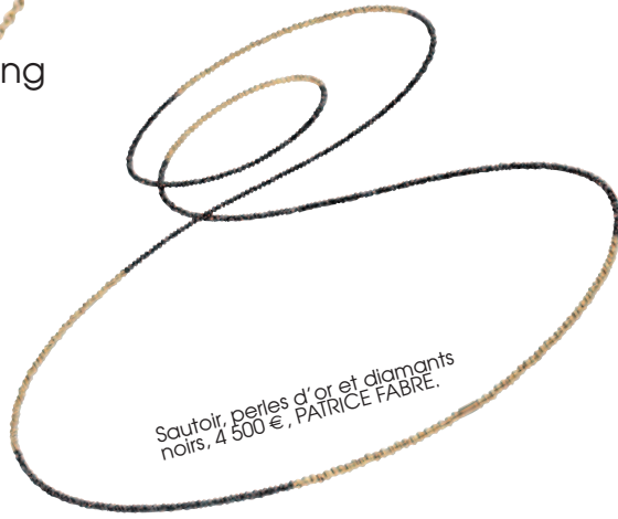
Sautoir, perles d'or et diamants noirs, 4 500 €, PATRICE FABRE.