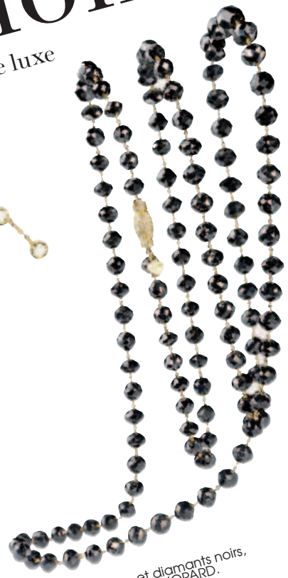
Sautoir, or jaune et diamants noirs, prix sur demande, CHOPARD.