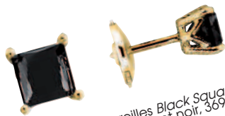
Boucles d'oreilles Black Square, or jaune et diamant noir, 369 €, OCARAT.