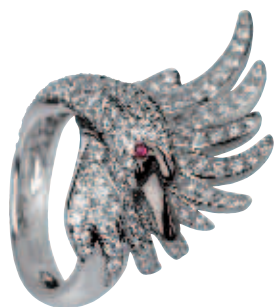
Bague Cypris , or blanc et diamants, prix sur demande, BOUCHERON.