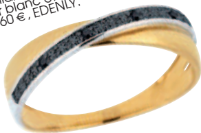
Alliance Funambule, or jaune, or blanc et diamants noirs, 160 €, EDENLY.