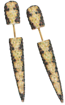
Boucles d'oreilles Grand Cône, or jaune, diamants noirs et saphirs, 6 890 € l'unité, PRISTINE.