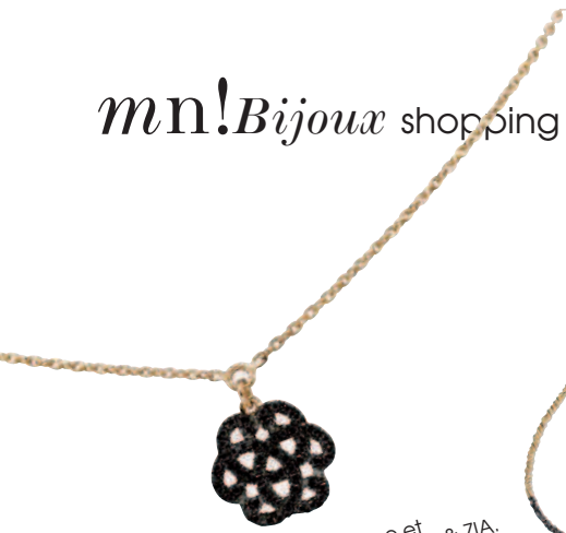
Collier Serenity, or jaune et diamants noirs, 1 190 €, RITA & ZIA.