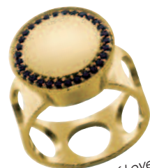
Bague Miracles of Love, or jaune et spinelle noir, prix sur demande, SIGOMONTA.