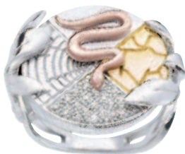
Bague Esprit de la terre , diamants, or blanc, rose et jaune, 890 €, EDENLY.