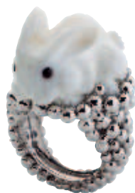
Bague Robert le Lapin , en calcédoine et or blanc, 5 400 €, GARNAZELLE.