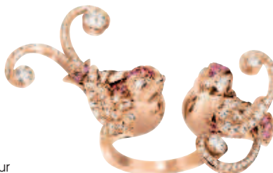
Bague entre les doigts Oiseaux de paradis , or rose, saphirs, spinelles et diamants, prix sur demande, VAN CLEEF & ARPELS.