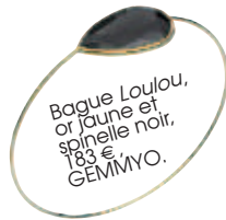
Bague Loulou, or jaune et spinelle noir, 183 €, GEMMYO.