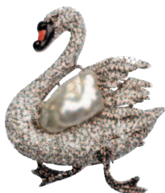
Broche Cygne , or blanc, diamants blancs et noirs, perle des mers du sud, prix sur demande, HENRI J. SILLAM.