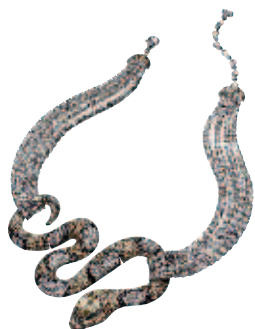
Collier Amazonie , or blanc, diamants bruns, diamants blancs et noirs, Prix sur demande, ADLER.

Apprivoisez votre instinct animal et révélez-le au grand jour ! Un retour aux sources originelles grâce aux créateurs qui, une fois de plus, n'écourent que leur talent.