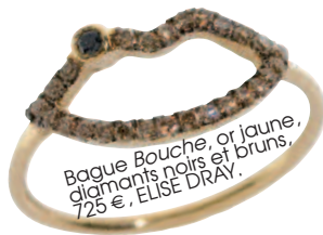
Bague Bouche, or jaune, diamants noirs et bruns, 725 €, ELISE DRAY.