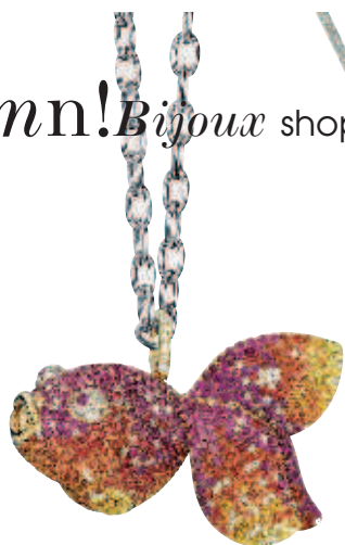
Collier Quinquin , or jaune pavage dégradé allant du rubis au saphir jaune orangé, prix sur demande, QEELIN.